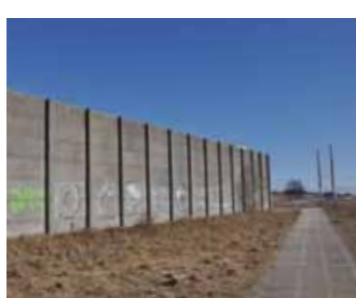
MUR: Søndre Havn