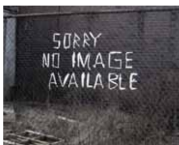
HEGN: Posemanden, Sorry No Image Available, 2012