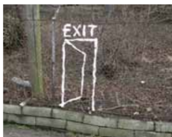
HEGN: Posemanden, EXIT, 2011, foto: Søren Behncke